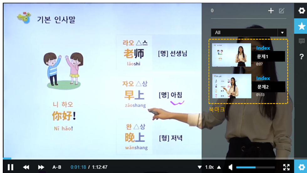
시청자 화면에 표시되는 문제 단위 별 분할지점 (북마크) 정보